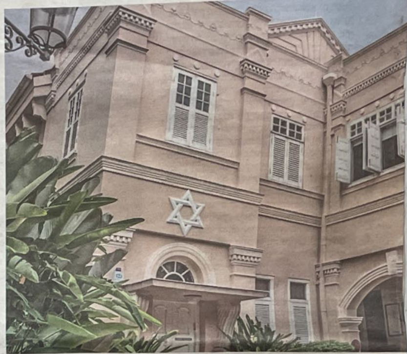
בית הכנסת "מגן אבות" בסינגפור