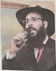
הרב נתנאל ריבני